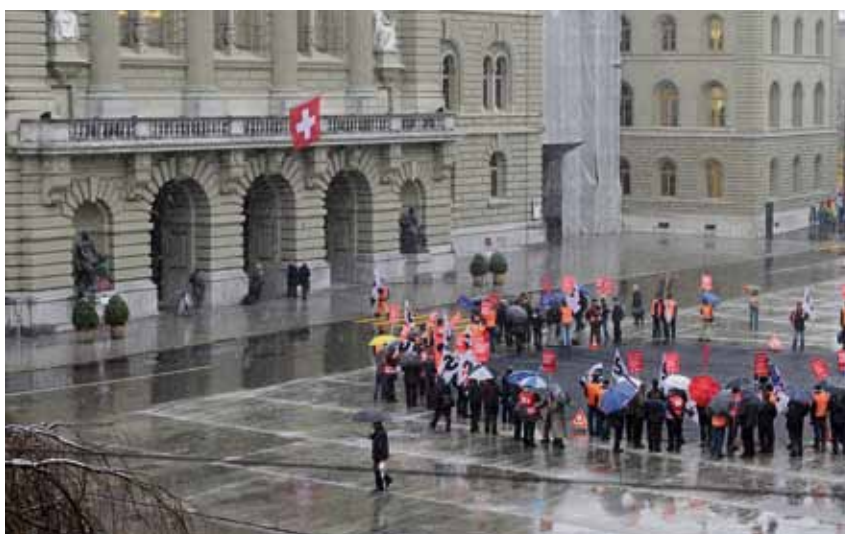
Les membres SEV déploient le « trou dans les caisses de pensions » sur la Place fédérale

Le personnel a dû avaler d'autres pas de démantèlement tels qu'une augmentation de la cotisation d'assainissement et le relèvement de l'âge de la retraite à 65 ans, liés toutefois à une légère diminution des cotisations ordinaires à la caisse de pensions.