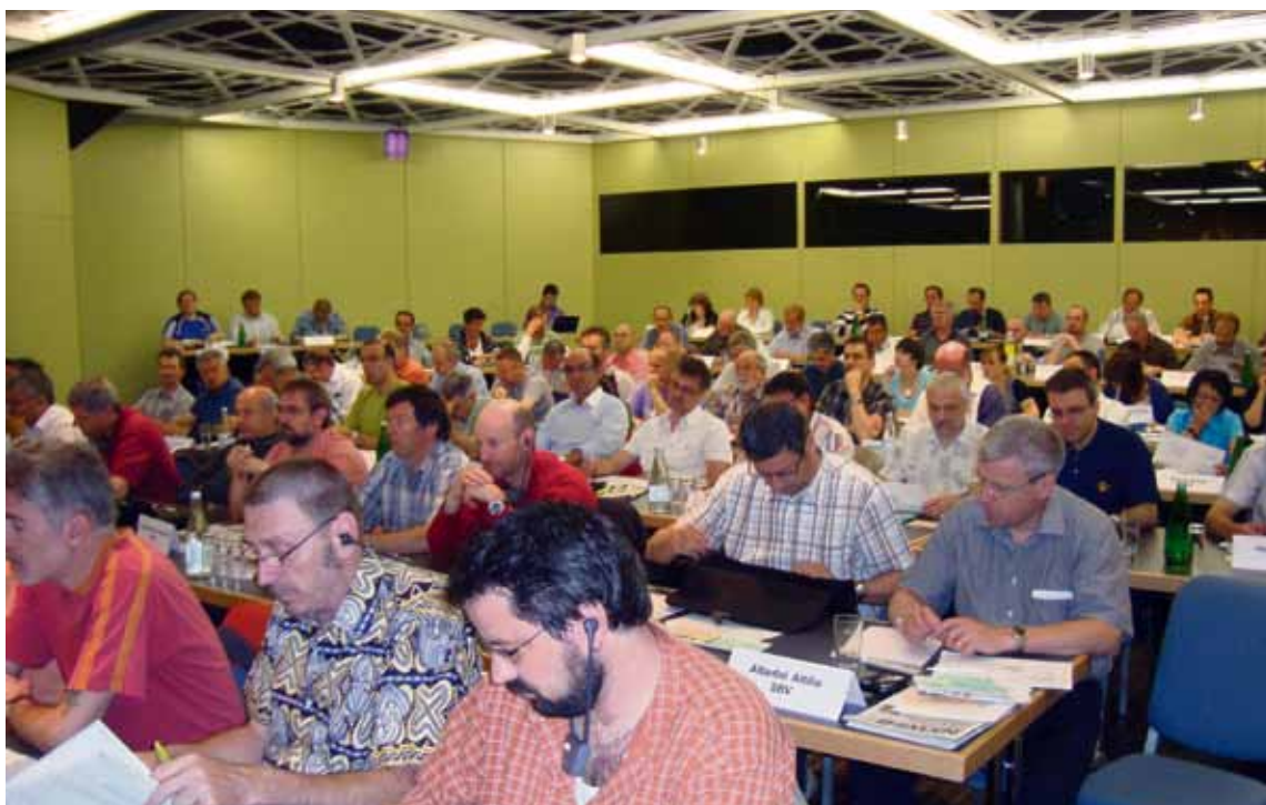
La commission CCT

Depuis 2009, il existe aussi une convention entre les CFF et les pensionnés. Les détériorations massives dans le domaine des FVP avaient conduit à un net mécontentement parmi les retraitées et retraités. Des contacts réguliers entre la sous-fédération des pensionnés et la direction des ressources humaines des CFF doivent permettre dorénavant d'aborder les thèmes suffisamment tôt. Des premiers succès ont été enregistrés dans les facilités de transport; les rencontres de retraités organisées par les CFF et l'envoi gratuit du Courrier ont également été accueillis positivement par nos aînés.