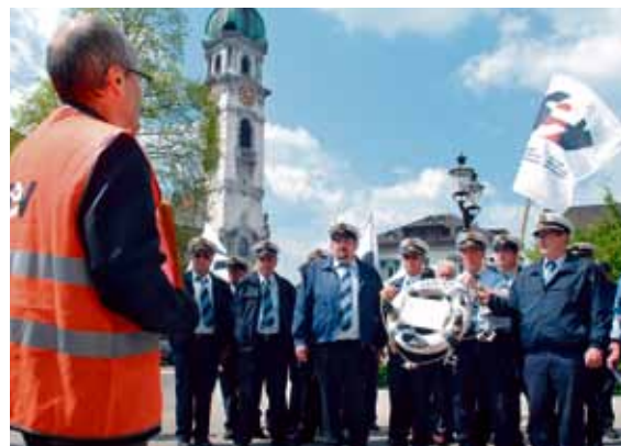
Le personnel de la compagnie de navigation sur le lac de Constance proteste contre les projets de démantèlement

Les bateaux qui naviguaient jadis sur le lac de Constance appartenaient aux CFF. La compagnie de navigation était alors la cause de bien des soucis pour l'entreprise ferroviaire; la compagnie est